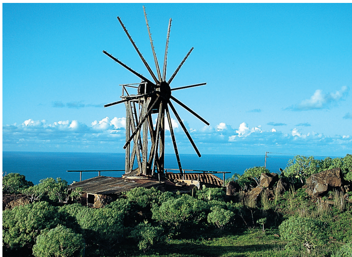
Oude molen bij Santo Domingo.

die zich in de verte verliest. Hier beperkt de natuur zich tot het essentiële, is nog helemaal aan de wetten van weer en wind onderhevig. Men moet deze landstreek gezien hebben om te beseffen hoe oneindig rijk ze is.