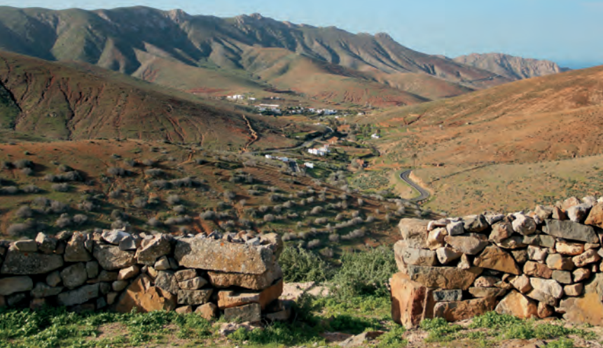
Briefkaartpanorama van het dal van Vega de Río Palmas.

De wandeling begint in Betancuria (1) bij het bushokje onder de parochiekerk. U gaat over de doorgaande weg (FV-30) in de richting van Vega de Río Palmas en komt na 150 m langs het archeologisch museum en bar Valtarajal. 50 m na de bar buigt u links af in een aanvankelijk geplaveide weg (wit-rood-groen bord) en u kunt gelijk een gerestaureerd waterrad bewonderen. Het pad loopt omhoog naar een teerstraatje (Calle San Buenaventura).