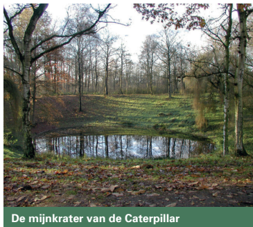
De mijnkrater van de Caterpillar

alsmede een monument voor de 1st Australian Tunneling Company. De kogelgaten in de bronzen gedenkplaat op het Australische monument zijn herinneringen aan gevechten in de Tweede Wereldoorlog die rond Ieper plaatsvonden. Bij de ingang van de site ligt een gedenksteen, waarop de opeenvolgende troepenbewegingen op Hill 60 staan vermeld. Op de top van de heuvel staat een gedenkteken voor de Queen Victoria's Rifles. Oorspronkelijk stond hier een groter monument, dat echter in 1940 door de Duitsers werd vernield. Het regiment liet na de Tweede Wereldoorlog een nieuw monument plaatsen, waarin enkele stenen van het oude monument werden verwerkt. Midden op het terrein staat een van origine Duitse bunker, die gebruikt