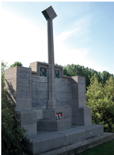
Hill 60-gedenkteken 14th Light Division 3

Het staat eenieder natuurlijk vrij om te stoppen bij willekeurig welk interessant geacht object. We volgen de Komenseweg tot aan de Zwarteleenstraat, die we linksaf ingaan. Na de spoorbrug is de parkeerplaats bij Hill 60. Om deze strategisch gelegen (kunstmatige) heuvel werd hardnekkig gevochten. Verschillende borden bij de parkeerplaats vertellen het verhaal van het ontstaan, de gevechten en de mijnslag rond Hill 60 en the Dump en de Caterpillar, die aan de andere zijde van de spoorlijn liggen. Het pokdalige terrein van Hill 60, met zijn mijnkrater, granaatrechters, betonnen bunkers en schuilplaatsen is één van de weinige authentiek gebleven oorlogslandschappen van de Westhoek. De indrukwekkende mijnkrater van de Caterpillar is bereikbaar via het wandelpad langs de overzijde van de spoorbaan. De krater heeft een diameter van 79,2 meter en een diepte van 15,5 meter en is daarmee de grootste krater van de Westhoek. Bij de parkeerplaats staat een herdenkingsmonument voor de Britse 14th Light Division,