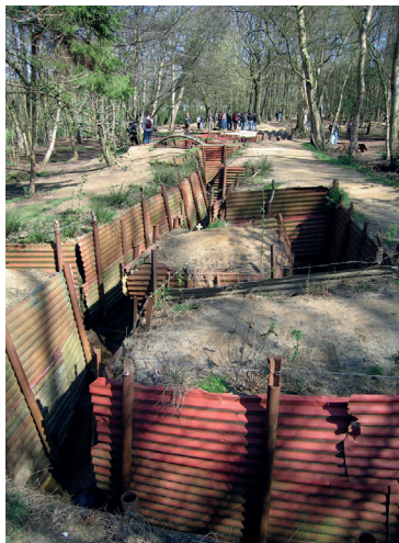
Hill 62 loopgraaf

Ieper. Om onze weg te vervolgen nemen we de afslag naar Geluvelid (Meenseweg/N8). Bij het bord 'Hill 62' gaan we rechtsaf de Canadalaan op en rijden door tot het Sanctuary Wood Museum Hill 62. In het café/restaurant is tevens een bescheiden museum