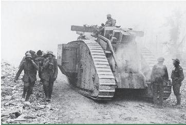
Duitsers voeren gewonde af langs Britse tank

stil te liggen. Maarschalk Foch wilde het offensief bij Amiens voortzetten, maar Haig kwam met een plan voor een nieuw offensief bij Albert. Foch ging hiermee akkoord en op 21 augustus viel het Britse 2e leger bij Albert aan over een 55 kilometer breed front. Het Duitse 2e leger werd teruggedrongen en op 22 augustus werd Albert ingenomen en op 29 augustus Bapaume. In de nacht van 31 augustus stak het Australische korps de Somme over. De geallieerden braken bij Péronne en Saint-Quentin door de eerste Duitse linies en tegen 2 september waren de Duitsers teruggedreven tot dicht bij de Hindenburglinie, waar vandaan zij hun lenteoffensief waren begonnen. Inmiddels had maarschalk Foch de eindoffensieven gecoördineerd vanaf de Noordzee tot de Maas. In eerste instantie waren deze offensieven gepland voor de eerste maanden van 1919, maar gezien de Britse successen in de Artois werd besloten direct door te pakken. Op 26 september begon het Frans/Amerikaanse offensief in de Argonne. Het Britse 4e leger in Picardië hervatte op 27 september