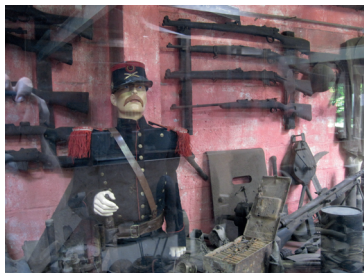
Sanctuary Wood Museum Hill 62

Als we onze weg vervolgen rijden wij de Zwarteleenstraat uit tot aan de Wervikstraat. Daar linksaf en via het dorp Zillebeke doorrijden tot de rotonde bij Ieper. Let op: in het dorp Zillebeke rechts aanhouden, richting Menen. Het richtingsbord staat, op z'n Belgisch, vanaf deze kant onleesbaar om de hoek. De plek van de rotonde bij Ieper was gedurende de Eerste Wereldoorlog de kruising die bekend stond als Hellfire Corner en waarvan gezegd werd dat het de gevaarlijkste plaats op aarde was. Het was zaak om hier zo snel mogelijk te passeren, omdat de Duitsers, die op ongeveer twee kilometer afstand zaten, vanuit hun verhoogde posities vrij zicht hadden op dit gedeelte van de Meenseweg (Menin Road) en hun artillerie in staat was met dodelijke precisie dit gedeelte onder vuur te nemen. Troepen op weg van en naar het front, colonnes met voedselvoorraden en materieel, alles moest voorbij dit gedeelte. Veel troepenbewegingen werden daarom 's nachts, onder dekking van het duister, uitgevoerd. Er werden langs sommige gedeeltes van de weg schermen opgesteld om het risico van noodzakelijke transporten bij daglicht zo veel mogelijk te beperken. Op de rotonde staat demarcatiepaal 19, op de hoek van de Meenseweg (N8) richting