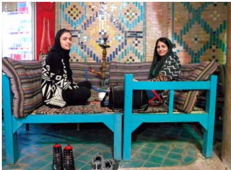
Vriendinnen in de Vakil Hammam in Kerman