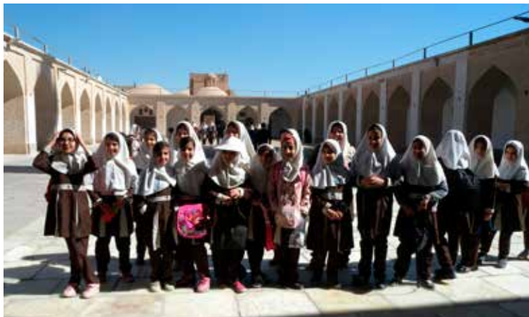
Groepsfoto bij de Vrijdagmoskee in Yazd

gaat schijnen, wordt het veel warmer en dan kun je een laag of misschien wel twee missen. In maart kan het nog sneeuwen dus een goede jas is ook van belang. Stevige schoenen voor de archeologische terreinen zijn noodzakelijk en je zult in de Islamitische bouwwerken ook vaak trappen moeten lo-