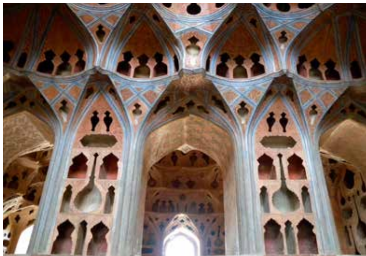
Ali Qapu paleis: muziekkamer

Aan de Ostandari Street, die evenwijdig loopt aan het Imam-Plein, ligt van noord naar zuid een viertal musea, waarvan vooral het Chehel Sutun Paleis de moeite van het bezichtigen waard is.