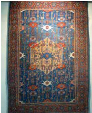
Bakhtari tapijt met semi florale motieven

De alleroudste Perzische tapijten werden tijdens de Achaemenidische periode gemaakt. Het oudst bestaande tapijt dat in Perzië is gemaakt, dateert uit de 5e eeuw voor Chr. en is gevonden in Pazyryk in Siberië in het graf van een Scythische prins. Het woord 'tapijt' komt van het Middelperzische woord 'tab' dat 'spinnen' betekent en het Farsi woord 'tafta' dat 'geweven' betekent. Een