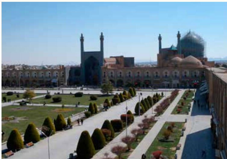
Imam plein met Imam Moskee

Om je verkenningstocht in Isfahan te beginnen, ga je natuurlijk eerst naar het Imam Plein