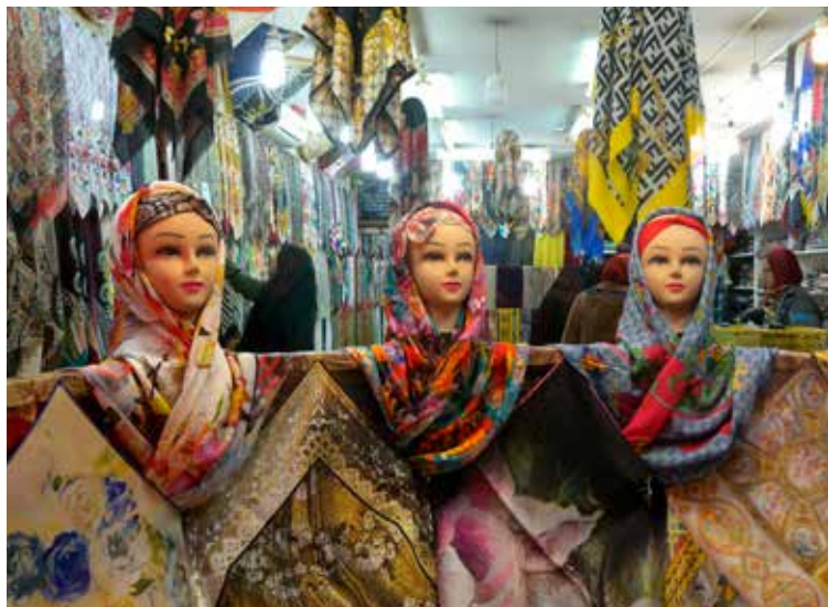
Bazaar in Kerman