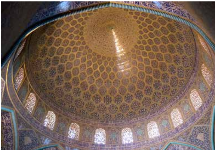
Sheikh Lotfollahmoskee, interieur: koepel en plafond van gebedshal

achtergrond, die in de namiddag roze kleurt. Via een gang met een knik, vanwege de juiste gebedsrichting naar Mekka, kom je in de indrukwekkende gebedshal met een diameter van 13m en alweer bijzondere mozaïeken. Naast de entree kun je met een trap naar beneden om de gebedsruimte, die in de winter gebruikt werd, te zien. Deze heeft een mihrab (gebedsnis) uit 1622. Geopend: dagelijks van 9.00-18.00 uur. Entree 200.000 rial. Alleen fotograferen zonder flits.