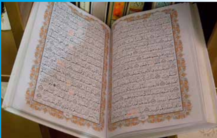
Kalligrafie in een Koran in het Mausoleum van Sjah Nematollah Vali Kermani in Mahan