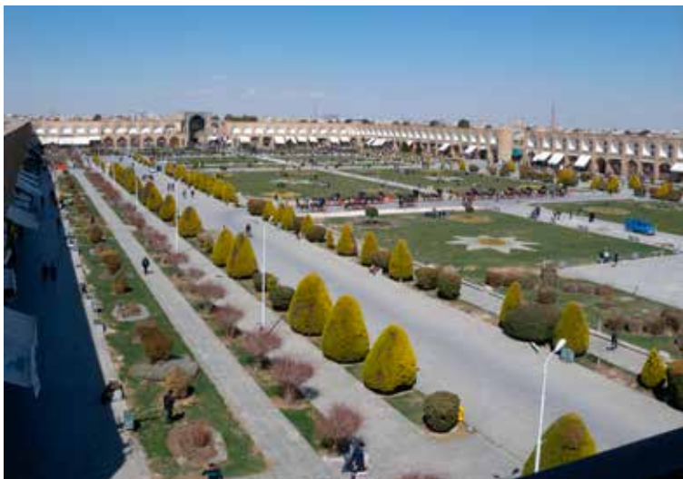
Imamplein (Naqsh-e Jahan)

Sinds de verdrijving van de Joden uit Jeruzalem, zo rond 605-562 voor Chr. vestigde dit volk zich in Isfahan naast de Christelijke en Zoroastrische gemeenschappen. Er zouden ook al eerder Joden naar Isfahan gekomen