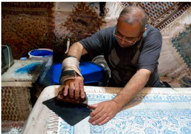
Qaysariye Bazaar: Ghalamkar: stof bedrukken

eeuw, ten westen de Karavanserai en aan de zuidkant het Imam-Plein.