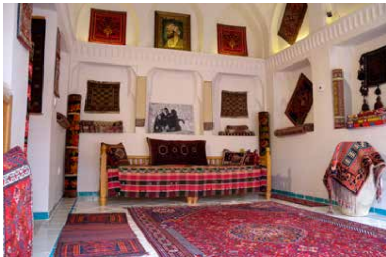
Winkel in Koopmanshuis Ameriha in Kashan

In de winter is het in Iran twee-en-een-half uur later dan in Nederland en in de zomer (tussen maart en september) is dat anderhalf uur.