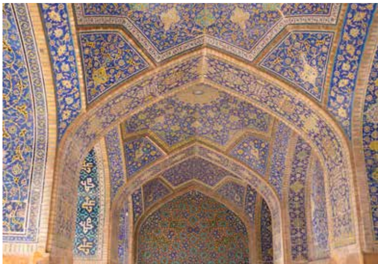
Het prachtige interieur van de Imammoskee

waarin je de weerspiegelingen van de imposante bouwwerken kunt zien. Eromheen liggen de noordelijke, westelijke, oostelijke en zuidelijke iwan met erachter de bijbehorende koepelvormige gebedsruimte geflankeerd door slanke minaretten. Via de zuidelijke iwan kom je in het belangrijkste heiligdom, dat een dubbele koepel heeft met een tussenruimte van 15 meter. Daardoor is de akoestiek bijzonder en kan elk geluid 12 keer in echo gehoord worden. Achter in het heiligdom vind je de mihrab (gebedsnijs) die de qibla (gebedsrichting) aangeeft en de minbar (preekstoel). Aan weerszijden van dit heiligdom zijn twee madrassa's (koranscholen), waarnaast de cellen van de studenten te zien zijn. Geopend: dagelijks van 9.00-18.00 uur. Entree 200.000 rial. Alleen fotografieren zonder flits.