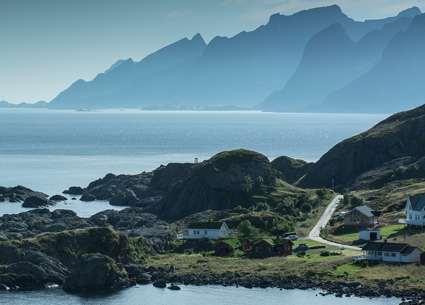
Uitzicht op Vester Nesland en de bergketens van Moskenesøya.

Het aansluitende pad voert omlaag naar een beek, die we oversteken. Daarna gaat het door een heuvelachtig terrein met drassige gedeeltes verder. Uiteindelijk komen we bij een klein rotsmassief, waar we rechts aanhouden en afdalen naar een steenslagweg (4) . Deze voert naar het centrum van Nusfjord (5) , waar ons koffie met gebak en ijs wacht.