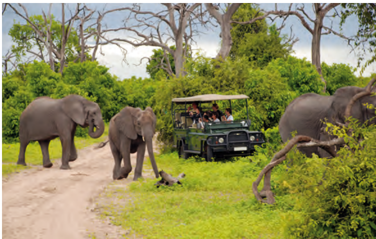
Op safari in het Chobe National Park, Botswana