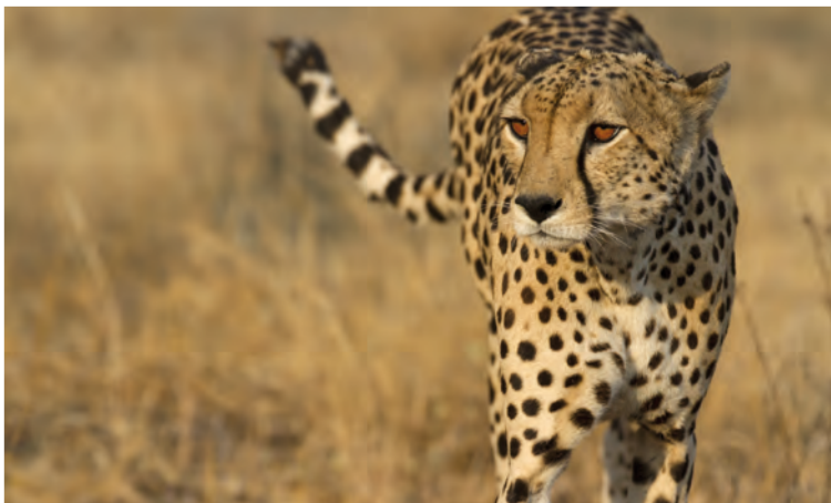
Cheetah of jachtluipaard

vlekken bevinden. Ze hebben doorgaans 2 hoorns, hoewel er uitzonderingen zijn die drie hoorns hebben.