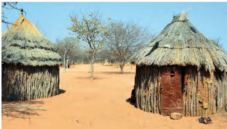
Himba woningen in Khorixas

De omgeving van Khorixas is interessant genoeg om deze te bezoeken. U moet er een stukje voor rijden. Vanuit Khorixas neemt u de C39 in westelijke richting. Na ongeveer