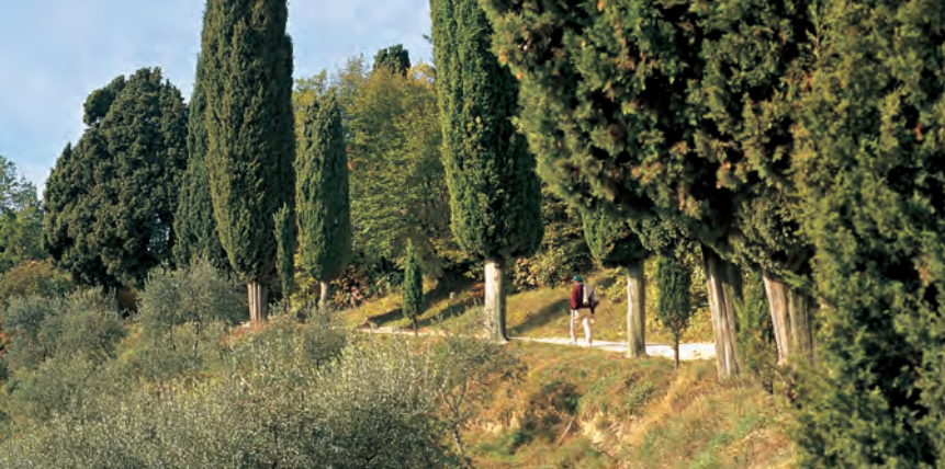
De toegang gaat eerst over een gerieflijk veldpad, daarna volgt alleen nog een voetpad.

Van de parkeerplaats bij de ingang van Sasso wandelt u in noordoostelijke richting het bekoorlijke plaatsje binnen. Blauwe pijlen en een padmarkering (nr. 31, rood, naar Briano en Comer) wijzen op enkele plaatsen de weg. Ga na 50 m links- en meteen weer rechts-af, daarna steeds rechtdoor. Hierbij passeert u een openbare 'wasplaats', waar men ook tegenwoordig nog zo nu en dan vrouwen met de hand kan zien wassen. Even later bereikt u het eind van het plaatsje. Een houten bord wijst u hier de weg naar San Valentino. Nu gaat het op een veldpad langs een lange muur. Aanvankelijk nog vlak, daarna door schaduwrijk bos op een smal, steenachtig paadje stevig bergopwaarts. Onderwijl doen zich mooie uitzichten op het meer en het stadje Gargnano voor. Na een ½ uur wandeltijd bereikt u een open plek. Hier splitsen de paden zich. U gaat rechts-af het bos in, waar u na enkele minuten bij een droge beekbedding komt; hierin daalt u op steile treden af. Vervolgens op gelijkblijvende hoogte langs de steile bergflank, daarna weer enigszins bergopwaarts; weldra bereikt u de toegang tot de kluis San Valentino , die door een poortje gemarkeerd is.