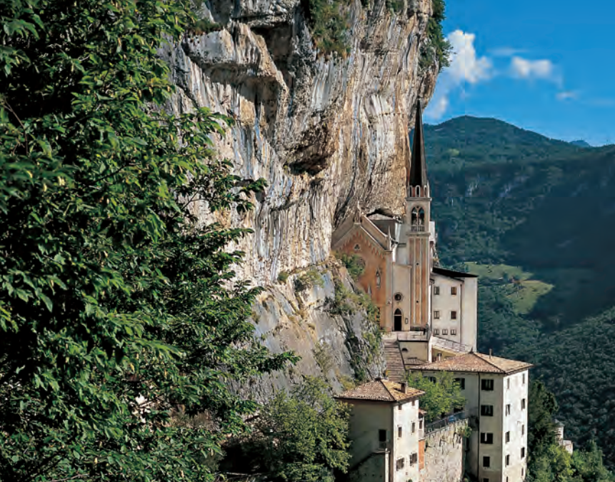
Het vlak tegen de rotsen aan gevlijde bedevaartsoord Madonna della Corona.

beginnen honderd meter omhoog. Aan het einde van de trap volgt u rechtsaf het goed begaanbare bergpad, dat u langs vroeger bebouwde berghellingen leidt, totdat u na ca. 20 min. een uitkijkpunt met een groot kruis bereikt (kort ommetje vanaf het pad). Nu verder bergopwaarts door bos, daarna lange traverse omhoog de Valle delle Pisotte in, waar u een woest rotslandschap wacht. Nu linksaf in haarspeldbochten naar de evenwijdig aan het pad lopende rotswand, die u via een gemetseld en gezekerd klimpad beklimt. Het vervolg van de route loopt nu iets minder steil, maar verder door bos. Weldra bereikt u een stenen brug en aan de overzijde daarvan het brede pad dat u via talrijke treden omhoog naar het bedevaartsoord Madonna della Corona brengt. Van daar leidt een afgesloten, smal landweggetje omhoog naar Spiazzì . U keert naar Brentino terug via de heenweg.