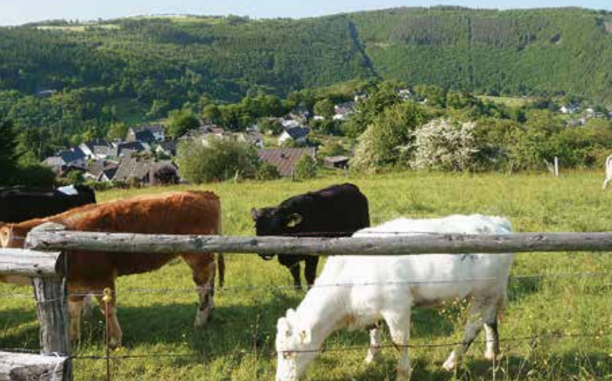
Weideland boven het Roerdal.

We beginnen in het oude centrum van Monschau (1) bij de Roerbrug (400 m) en gaan via de Rurstraße naar de markt. Hier gaan we rechts tussen twee restaurants de trap op naar Oberen Mühlenberg en slaan na ongeveer 50 meter rechtsaf de 'Rusejässje' in. Aan het einde volgen we een pad omhoog naar een eerste uitkijkpunt en verder omhoog naar de Eifel-Blick op de Kierberg (449 m), waar ons een nog mooier panorama over de stad en het kasteel wacht. Het pad gaat verder langs een kapel tot aan een lichte waterval. Daarna wandelen we over een bospad en uiteindelijk over een weg naar beneden naar de Romeinse glasblazerij in Burgau (411 m, 20 min., horecagelegenheid, parkeerplaats).