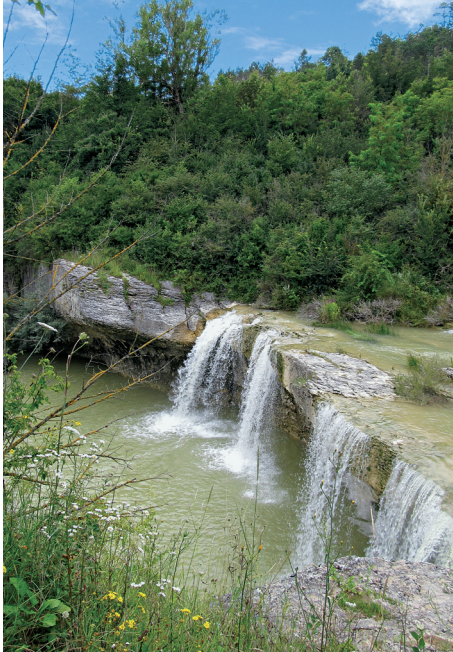
De watervallen van de Pazinčica.

Teruggekeerd bij de molensteen volgt u het stijgende voetpad, weg van de rivieroever, en komt uit bij een rijweg, die rechtsaf naar de oude stadskern van Pazin (7) voert. Als u de huizen heeft bereikt, gaat u rechtsaf richting kasteel. Ga rechts langs de muren van het kasteel om het plein voor de poort te bereiken, waar het café 'Jules Verne' is gevestigd (eetgelegenheden). De beroemde schrijver heeft deze plaats en de nabijgelegen grot vermeld in zijn roman 'Matthias Sandorf'. Vervolgens gaat u dalend naar een brug die over de rivierkloof is gebouwd (links toegang tot de weg door de kloof, zie variant). Op de andere oever klimt de asfaltweg weer en leidt rechtstreeks naar de parkeerplaats (1) , waar deze wandeling begon.