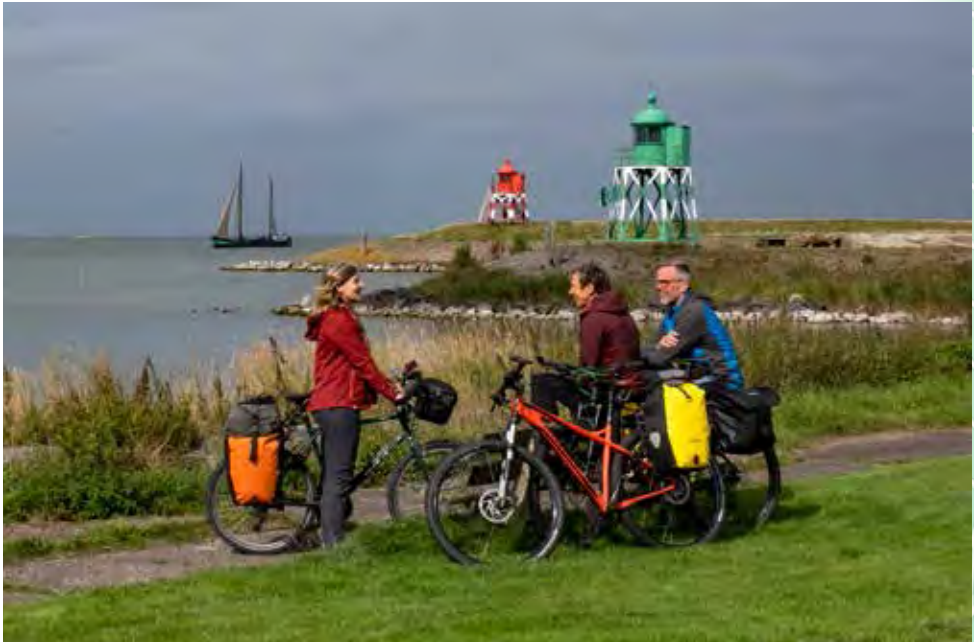
De havenmond van Stavoren

In dit boek worden 11 etappes beschreven, die de elf steden van Friesland met elkaar verbinden. Ik heb geprobeerd de mooiste route te vinden tussen de steden, door zo veel mogelijk mooie fietspaden met elkaar te verbinden. Het liefst fietspaden die niet langs een hoofdweg lopen. De steden liggen verspreid door heel Friesland, maar niet altijd op een gelijke afstand van elkaar.