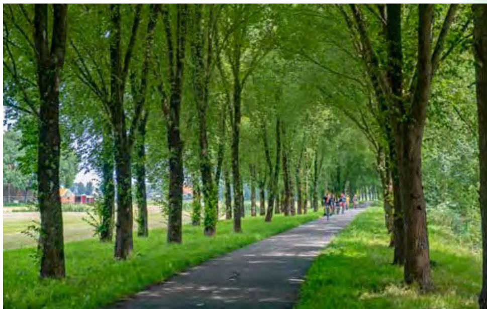
Het fietspad op weg naar Irnsum

Sommige plaatsen in Friesland gebruiken hun Friese naam als officiële naam, zo ook Reduzum. In het Nederlands heet het Roordahuizum. Het dorp is ontstaan op een