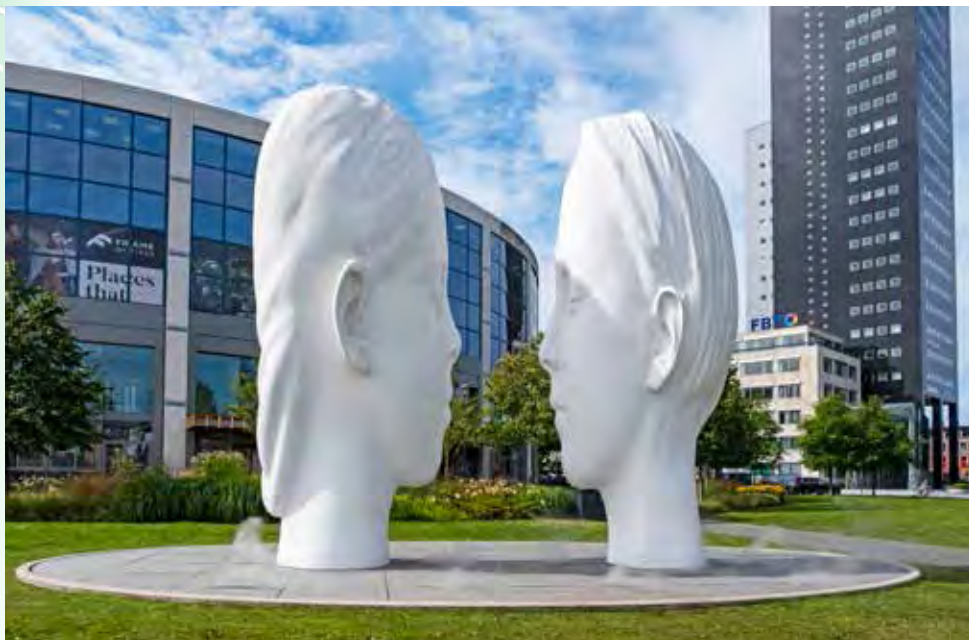
De fontein voor het station in Leeuwarden

In principe kan je de route fietsen met alleen deze topografische kaarten. Ter ondersteuning is het gemakkelijk om de knooppunten die je bij ieder traject vindt