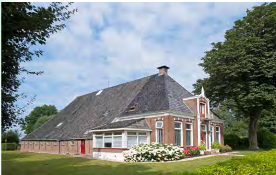
Een boerderij in Irnsum

De kleigrond rond Jirnsum was ideaal voor veeteelt. Toen handel en transport belangrijker werden verschoof het dorp langzaam van de terp naar de oevers van