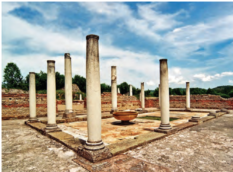
De overblijfselen van de Romeinse stad Felix Romuliana

De Romeinen veroverden vanuit Singidunum een groot deel van de Balkan, slag