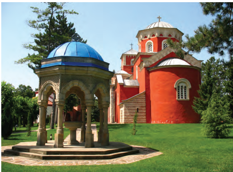
Het klooster Žiča is fel rood gekleurd

zes figuren, waarvan Petrus, Lucas, Simon en Thomas nog te herkennen zijn, stammen uit de eerste helft van de dertiende eeuw en behoren daarmee samen met de schilderijen in Studenica tot de oudste van Servië. De rest van de fresco's is nieuwer, maar ook daar zitten interessante stukken tussen.