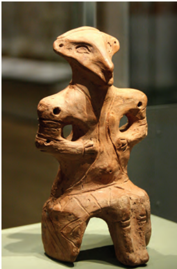
Een kleifiguur uit de Vinča cultuur

Andere archeologische ontdekkingen in Oost-Europa zijn in verband gebracht met Vasić' opgravingen, waardoor we nu in het algemeen spreken over het Vinčavolk dat leefde in het gebied van het huidige voorma-