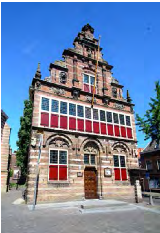
Raadhuis in Woerden

parkeergarage Castellum onder het Kerkplein is het archeologisch onderzoek naar het fort zichtbaar gemaakt. Bovengronds zijn de contouren van een Romeinse kazerne verwerkt in de bestrating. Naast vele archeologische voorwerpen werden in en rond Woerden ook Romeinse schepen gevonden. Eén vrachtschip is gereconstrueerd; dat vaart tegenwoordig door de Woerdense singels. Tijdens de binnenlandse oorlogen tussen de zgn. soldatenkeizers in de derde eeuw verzwakte deze eens zo sterke limes door invallen van Germanen en Franken. Ondanks latere herstellpogingen kwam het nooit meer goed met de linie. Exit Imperium Romanum.