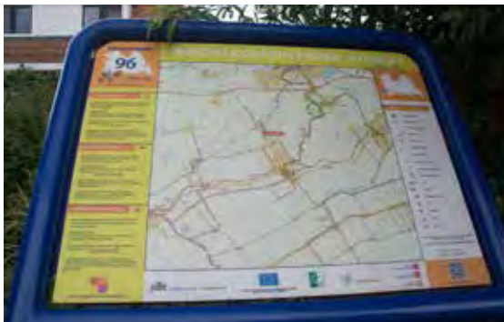
Infopaneel op knooppunt 96 op Hekendorp-route bij Oudewater in wandelnetwerk Groene Hart Utrecht

Kaartjes en informatie over het netwerk zijn te vinden op de provinciale website www.routesinutrecht.nl (inclusief routeplanner) en de gelijknamige app. Ook is het netwerk terug te vinden op de landelijke site www.wandelen123.nl (eveneens inclusief routeplanner en app).