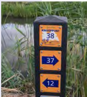
Knooppuntpaal 38 in wandelnetwerk Groene Hart Utrecht

Tegenwoordig is het grootste deel van de provincie Utrecht bedekt met wandelnetwerken. Dat betekent voor de wandelaar honderden kilometers aan gemarkeerde wandelroutes. Gele pijlen wijzen de weg, van knooppunt naar knooppunt. Routebeschrijvingen zijn daarmee overbodig geworden. Je hoeft alleen de nummers van je route bij je te hebben.