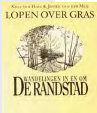
Voorkant van voorloper en inspiratiebron Lopen over gras (uitg. Bert Bakker, 1982)

Rother-gidsjes uit Duitsland. Groot verschil met vroeger is het gebruik van kleuren en topografische kaartjes. Voor de kleurstelling, het lettertype en de plaatsnamen op die kaartjes hebben we samen met cartograaf Aad Mak gekeken naar topografische stafkaarten van rond 1900 in de serie Bonnebladen – in een retrostijl dus. Naast onze eigen foto's hebben we (natuur)historische illustraties en kaartjes opgenomen, afkomstig uit de beeldbanken van hoogheemraadschappen, Rijksdienst voor Cultureel Erfgoed, Rijksmuseum, Shutterstock, historische verenigingen en atlassen en Wikipedia. Ook dat is een verschil, evenals het ontbreken van routebeschrijvingen: we geven alleen de nummers van de te volgen knooppunten en de kleuren van de richtingpijlen. Het rijtje nummers volstaat voor een dag wandelplezier.