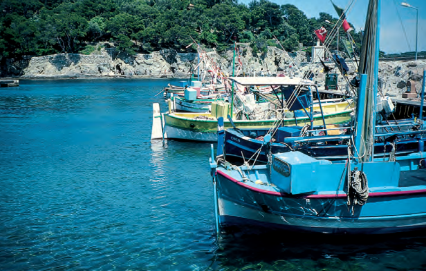
Een haven: in Port du Niel leggen we twee keer aan.

due (4). Daal af naar de aanlegsteiger van Porquerolles en houd rechts naar de voortzetting van het sentier du littoral .