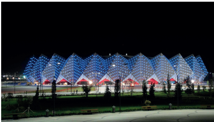
Crystal Hall, Bakoe

Wat het eerst opvalt in Bakoe zijn de drie enorme, puntig toelopende 182 meter hoge wolkenkrabbers in het centrum, die boven alle bebouwing uitrijzen. Samen vormen ze sinds begin 2014 de Vlammen Torens. Zo genoemd omdat ze het symbool verbeelden van dit land: de nooit dovende vlammen. Eén toren is hotel, een ander een appartementencomplex, en de derde een kantorencomplex. Samen omsluiten ze een enorm atrium, met kantoren, theaterfaciliteiten, winkels en