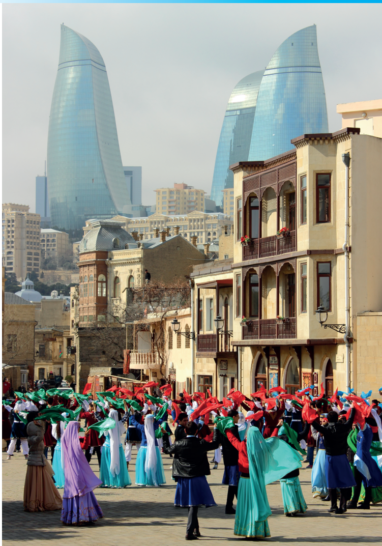
Feest ter gelegenheid van de Dag van de Republiek in Bakoe, herdenking van de onafhankelijkheid in 1918