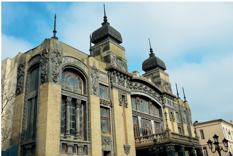
Staatsheater voor opera en ballet in Bakoe

naar Qobustan stoppen bij het Azneft Park. Er is ook nog een standplaats voor deze collectieve taxi's aan de Samainka, die je bereikt als je van de ingang van de Velotrek bazaar uit, op hetzelfde trottoir zo'n 500 meter (richting: de stad uit) loopt.