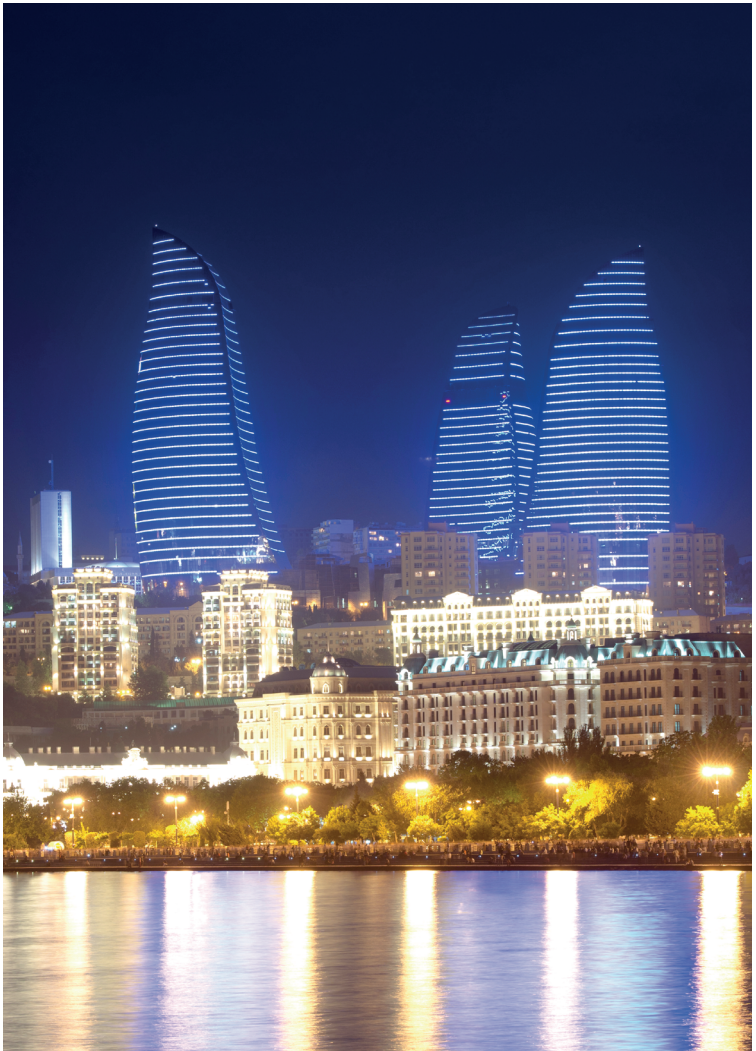
De Vlammen Torens staan symbool voor het nieuwe Bakoe