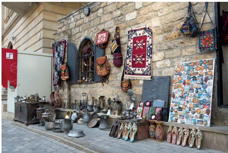
Winkeltje met allerlei ambachtelijke kunst

De dichtvorm gazel is al vrij oud. De oorsprong ligt in de 6e-eeuwse voor islamitische Arabische dichtkunst. In Azerbeidzjan is deze dichtkunst bekend geworden door de 16e-eeuwse dichter Fuzuli en de 19e-eeuwse dichter Mirza Ghalib. Maar het bekendst