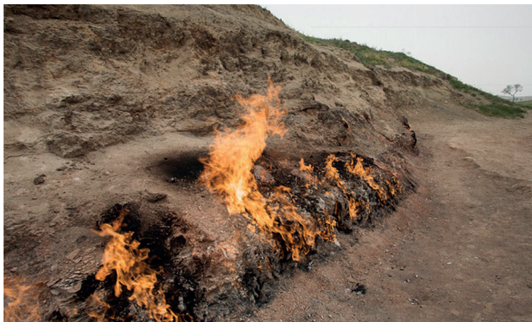
Het land van de nooit dovende vlammen