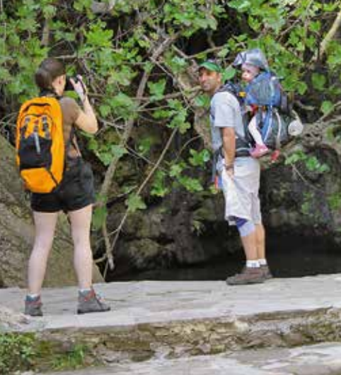
Fotomoment bij de vijgenboom bij de Baden van Aphrodite.

gen splitsing gaat u schuin links verder over de hoofdweg omhoog. Ruim 200 m daarna verlaat u de grindweg naar rechts op een pad dat slingerend tegen de helling van de Sotiras omhoog voert. Dit pad bereikt na ongeveer 75 m een karrenspoor, maar u blijft het pad volgen tot deze enkele minuten later uitkomt op dat karrenspoor. Nog altijd klimmend splitst zich een kleine 5 min. later in een bocht naar links een pad naar rechts af (de latere doorgaande weg). U bereikt nu de tafelberg en blijft het karrenspoor verder volgen tot dat na korte tijd op een