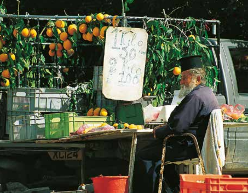
Aan het begin van de wandeling bij de Baden van Aphrodite kunt u nog wat fruit inslaan.

Kefalovrisia (3) , 270 m. Aan de kruising met wegwijzers en twee bankjes kunt u rechtdoor verdergaan op de Smigies Trail (wandeling 4). Deze wandeling gaat bij de bron links naar beneden verder op de Adonis Trail. Het pad voert langs een drooggevalen bedding door een mooi dal waar in het voorjaar Cypriotische cyclamen ( Cyclamen cypricum ) en andere wilde planten bloeien.