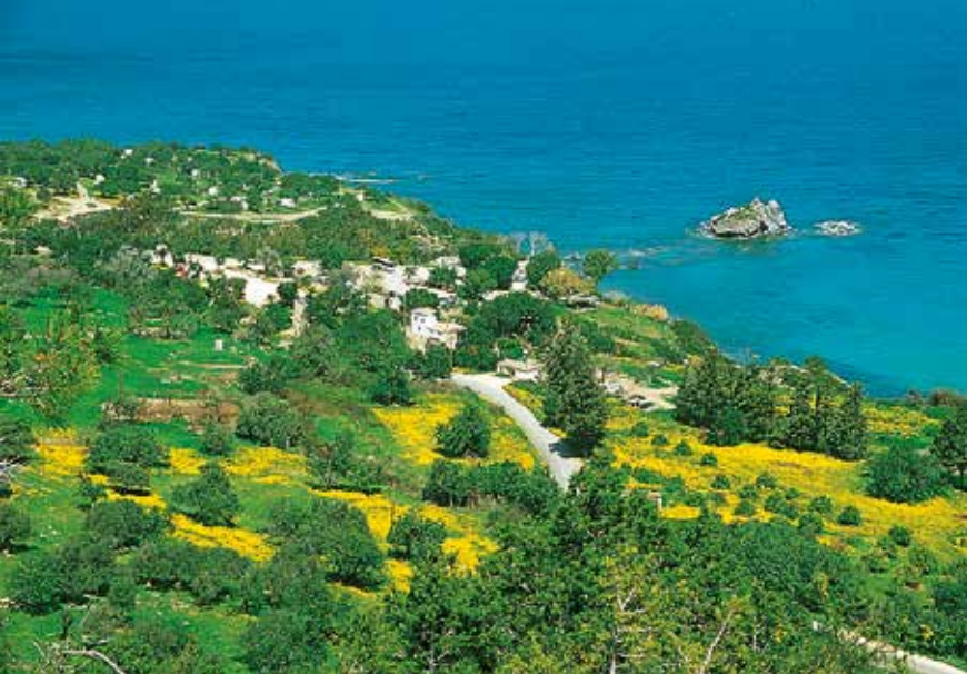
Bloeiende chrysanten bij de Baden van Aphrodite.

over de Golf van Chrysochou en de in het voorjaar heldergroene weiden. Het onverharde pad voert daarna door een licht bos van jeneverbesstruiken. Op de splitsing bij kilometerpaal 1 gaat u rechtsaf en beklimt u in een wijde bocht de zuidoostelijke helling van de Moutti tis Sotiras. U negeert een van links aansluitende weg en een kwartier later bereikt u (als geroepen) weer een bankje waar het uitzicht subliem is. Het grootste gedeelte van de klim over het ongelijkmatige pad heeft u nu achter de rug. Enkele minuten voorbij een door een hek afgeschermd gebied waar het inheemse Cypriotische brandkruid ( Flomis cypria ) groeit, gaat u niet rechtdoor in de richting van de tafelberg, maar linksaf (de splitsing ziet u gauw over het hoofd!) en bereikt u 3 min. later bij een grote galeik ( Quercus infectoria ) Pyrgos tis Rigainas (2) , 240 m. Volgens de legende zou Aphrodite zich na het baden hebben teruggetrokken. In de middeleeuwen werd hier een klooster gesticht, waarvan helaas nog slechts enkele muurresten en een kleine kapel de tand des tijds hebben doorstaan.