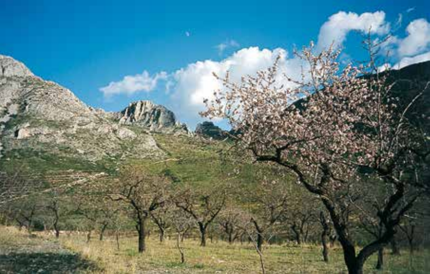
Blik omhoog naar de Paso de los Contadores.

Vanaf de Refugio de l'Arc (1) lopen we terug naar de afslag (bordje 'PR-CV 9, Benimantell 13 km') en rechts op de bosweg langs dennen omhoog. Na ca. 15 min. zien we rechts, achter een natuurstenen huis, een opvallende rotstoren, waarlangs we op het eind zullen afdalen. Iets later zien we links het huis L'Arc del Canonge (2) ; 1,8 km vanaf de start) en rechts een oude dorsplaats (Spaans: 'era'). In de verte zien we al de Paso de los Contadores en de Peña Roc (zie wandeling 27) links daarvan. 1 km verder bereiken we de inrit naar een huis (La Bodega) en iets later gaan we op een splitsing (3) rechtsaf. 1 km verder slaat tegenover het witgekalkte huis Mas de Indoro (4) links een pad af (het is de toegang tot de klim naar de Peña Mulero en stuit daar op wandeling 27). We bereiken uiteindelijk de splitsing, 690 m, aan de voet van de Paso de los Contadores (5) ; bordje 'Coto privado de caza'; links gaat naar de pas omhoog, zie variant). Hier rechtdoor (blauwe stip) en over de helling bijna horizontaal in zuidoostelijke richting verder met heerlijk uitzicht op het dal en de