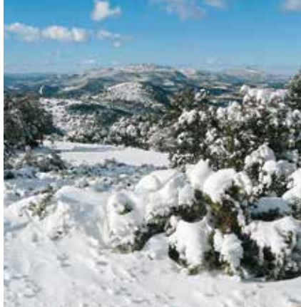
De 'Witte Kust' in winterkleed.

Stevige schoenen met een goede profielzool zijn voor alle wandelingen vereist, bij de meeste wandelingen wordt uitgegaan van de gangbare wandeluitrusting: functionele kleding, bescherming tegen regen, wind en kou, zonnecrème. Eet- en drinkgelegenheden zijn er onderweg zelden, en bronnen kunnen opgedroogd zijn – neem daarom altijd voldoende proviand en vooral ruim voldoende drinken mee. Wandelstokken zijn aan te raden, vooral voor afdalingen over los puin.