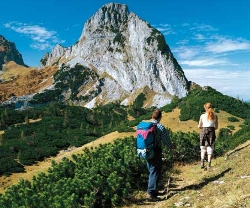
Hoher First (links), Großer Traunstein (midden), Berliner Kreuz (boven de persoon rechts).

25 min. te voet naar het bergstation (Karkogelhütte).