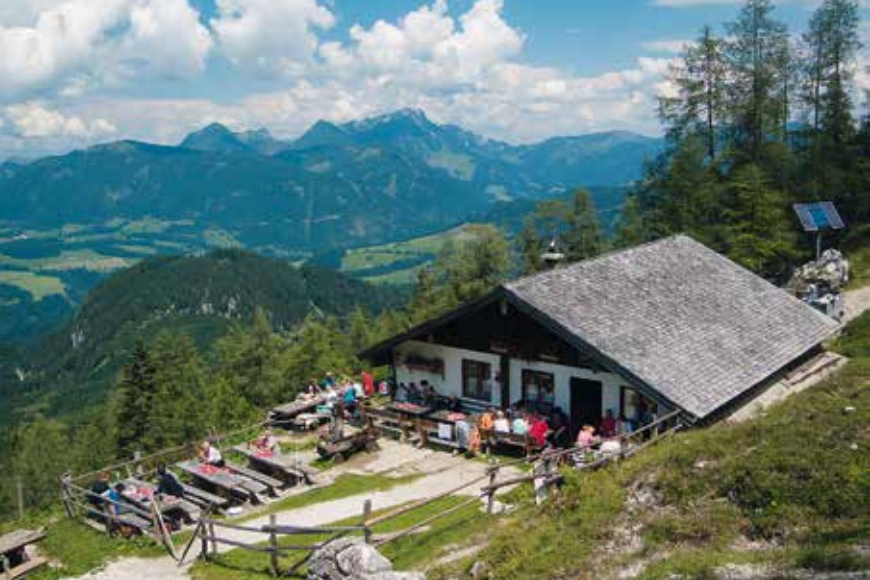
Naar de Gsengalm wandelen veel gebruikers van de Karkogelbahn.

het door bergdennen omzoomde Berliner Kreuz (5) , 1594 m. De Schober benadert u van de Gsengsattel in een boog naar links. Horizontale en verticale, platgetreden rotsbanden – op een plaats door een draadkabel van hun scherpe kantjes ontdaan – faciliteren de klim via een steile flank vol stenen en bergdennen naar zijn zuidwesttop (6) , 1810 m. Naar de lagere, met een kruis bekroneerde noordoosttop (7) , 1791 m, volgt u de gevarieerde graat links, daalt af in twee smalle cols en beklimt dan met behulp van kabels twee rotsterrassen, alvorens u via een steile rotsrug het doel bereikt. Langs de bekende route keert u naar de Gsengalm (3) en naar de Karkogellift (2) terug.