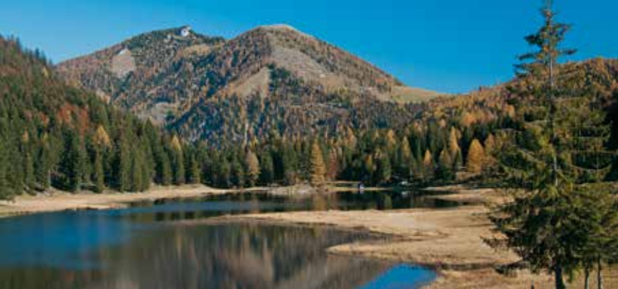
Seewaldsee met Hochwieskopf (links) en Hochbühel.

(geopend eind mei t/m okt.), Christlalm en Wimmeralm (beide alleen bij variant 4, geopend juni t/m okt.).