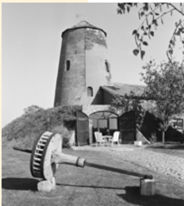
Molenromp 'De Goede Verwachting' Dassemus

waarschijnlijk aan 'misse' dat 'drassig gebied met essen' betekent. De huidige naam wordt pas na 1840 gebruikt. Twee plekken in buurtschap Dassemus verdienen de aandacht. Allereerst valt in het landschap de molenromp op van de Beltmolen 'De Goede Verwachting' aan het Moleneind. Deze molen werd volgens het opschrift in de kap in 1830 gebouwd en maalde vanaf 1834. Het is een zogeheten bergmolen. Het stellen en vastzetten van de wieken op de windrichting gebeurde op de 'berg', de aarden verhoging, waar de molen op staat. Rond 1927 is de molen onttakeld. De molenromp wordt in 1988/1989 gerestaureerd en verbouwd tot woonhuis, waar-