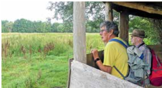
Vogelkijkhuis Natuurgebied Het Broek

Het is een waar paradijs voor kikkers, vinpootsalamanders en kleine watersalamanders. Het is ook een prima leefgebied voor kleine zoogdieren en insecten. In het gebied komen meer dan honderd vogelsoorten voor. De steenuil en roodborstapuit nestelen hier, evenals nachtegaal, patrijs, kwartelkoning, spotvogel en bosrietzanger. Het natte gebied heeft een grote aantrekkingskracht op allerlei andere vogels zoals kemphaan, watersnip, grutto en kiekendief.