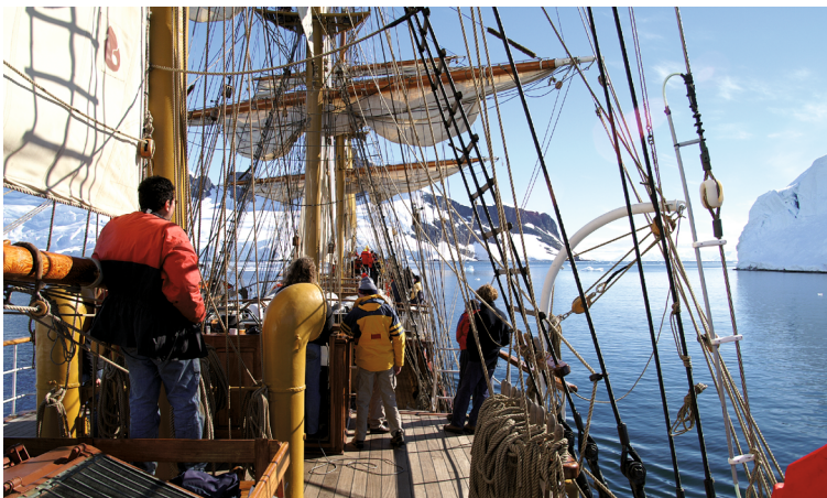
Zeilend naar Port Lockroy

Ten tijde van de Tweede Wereldoorlog werd hier door de Britten een hut gebouwd als onderdeel van Operation Tabarin. Onder de noemer van wetenschappelijk onderzoek werden vijandelijke activiteiten in de gaten gehouden. Na de oorlog werd het station het eerste Britse, permanent bemande station en kreeg de naam Bransfield House. Er werd voornamelijk onderzoek verricht op botanisch, meteorologisch en geologisch