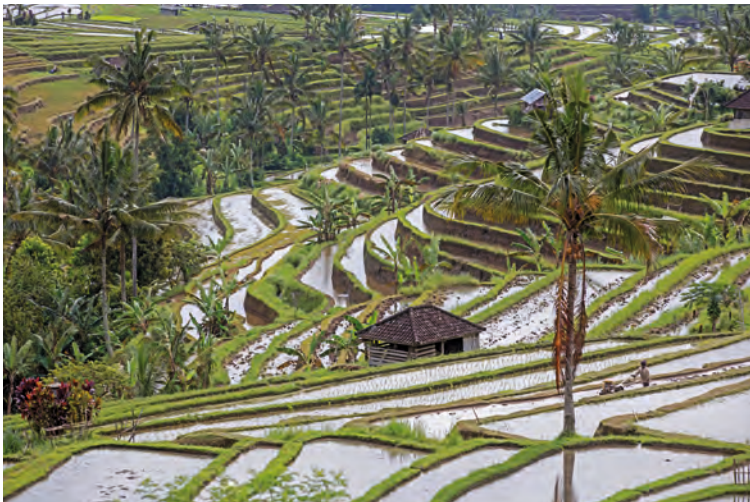
De Jatiluwih rijstterrassen

zijn met afstand de mooiste rijstvelden op Bali. De terrassen liggen prachtig tegen de bergwand. Als je erop neerkijkt is het een kleurrijke puzzel van rijstvelden in verschillende stadia, de kleinste plantjes vormen bruine waterige veldjes met groene stippen, dan zijn er groene veldjes waar de rijst al wat gegroeid is en er zijn ook nog rode veldjes waarop rode rijst verbouwd wordt. Het is mogelijk via een aangegeven pad tussen de rijstvelden door te wandelen. Tussen de rijstvelden krijg je weer een totaal ander perspectief.