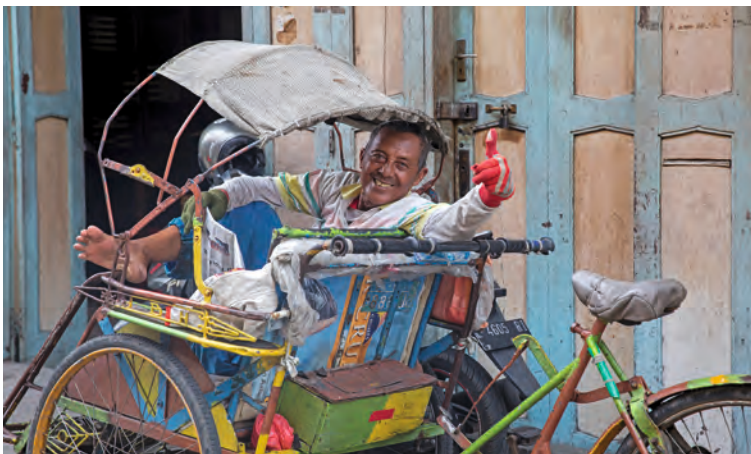
Vervoer per Becak