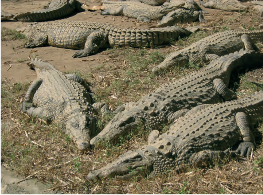
In de Croc-farm bij Ivato.

eenmaal per week. Dan gaat er 1200 kg vlees, dus meer dan een kubieke meter, over het muurtje. Het grootste exemplaar, een Nijl-krokodil, is 5,20 meter lang en weegt ongeveer 800 kg, terwijl een pas geboren krokodil slechts 15 cm meet. Zo een kun je nog een tijdje als huisdier houden, maar op een gegeven moment gaat het beest het huishouden regeren en probeer dan maar eens 800 kg onwillig vlees met scherpe tanden van de bank af te krijgen als er bezoek komt. Dan is een kat, hoewel ook een carnivoor, toch wel wat makkelijker in de omgang.