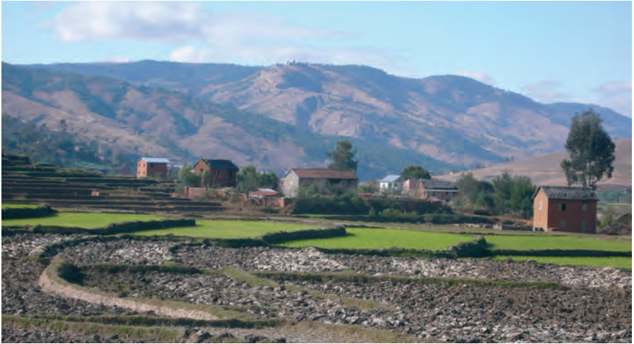
Een groene vallei met terrassen voor de rijstproductie.