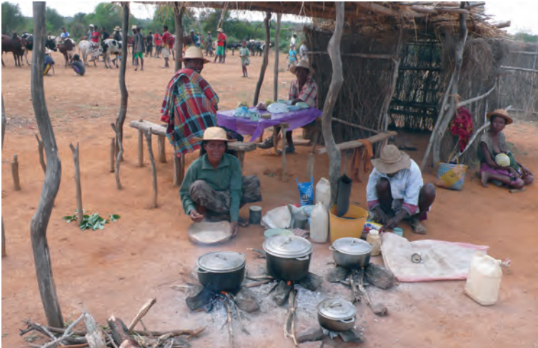
Restaurant op de markt.